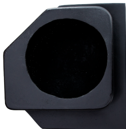
GCPCAJX3TRASIZQ CAJÓN TRASERO X3 IZQUIERDO