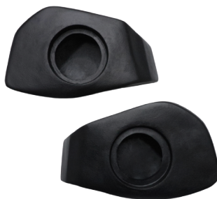
GCPPANPSUPMAVR PANELES DE PUERTA SUPERIORES MAVERICK-R