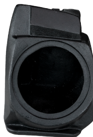
GCPCAJGUANPRO CAJÓN DE GUANTERA RZR PRO