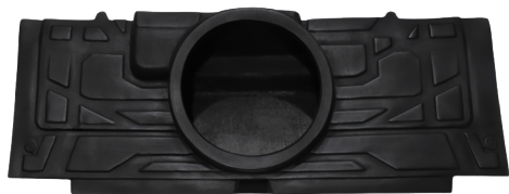
GCPCAJPROTRAS CAJÓN TRASERO RZR PRO XP