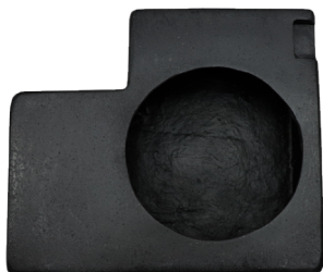
GCPCAJTURRTRA CAJÓN PARA SUBWOOFER 10 RZR TURBO-R TRASERO