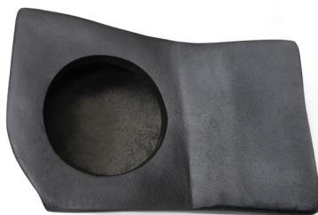
GCPCAJDEL CF MZF

CAJÓN TRASERO PARA SUBWOOFER 10 MAVERICK-R