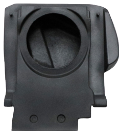
GCPUTVSM AVR P