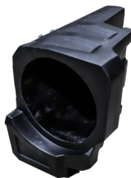
GCPCAJPROTRASSV CAJÓN TRASERO RZR PRO