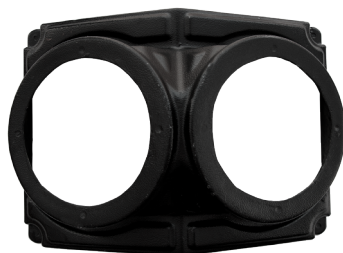
GCPCAJVOLTECX3 CAJÓN VOLCÁN DOBLE DE TECHO 6.5 MAVERICK X3