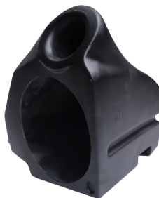
GCPCAJGUARZR100 CAJÓN DE GUANTERA RZR 1000