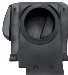
GCPUTVSM AVL P