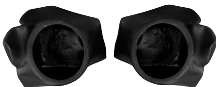
GCPCAJPIERZR100 PANEL PARA PIES RZR 1000 PARA BOCINAS DE 8 PULGADAS