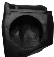
GCPCAJGUAULT CAJÓN DE GUANTERA RZR 1000 ULTIMATE