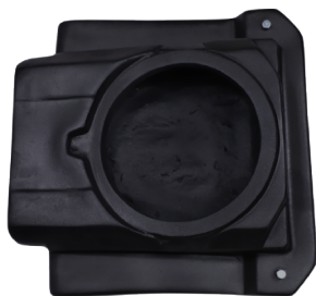
GCPCAJMAVRDEL CAJÓN PARA SUBWOOFER 10" DELANTERO MAVERICK-R