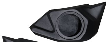
GCPPANPUETRAPRO PANELES PUERTA TRASEROS PARA RZR PRO-R, PRO XP