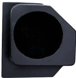
GCPCAJX3TRASDER CAJÓN TRASERO X3 DERECHO