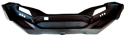
GCPFACTURBOSF FACIA TRASERA TURBO-S