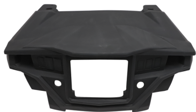
GCPPANRAIRZR100 PANEL PARA RAID COMMAND RZR 1000